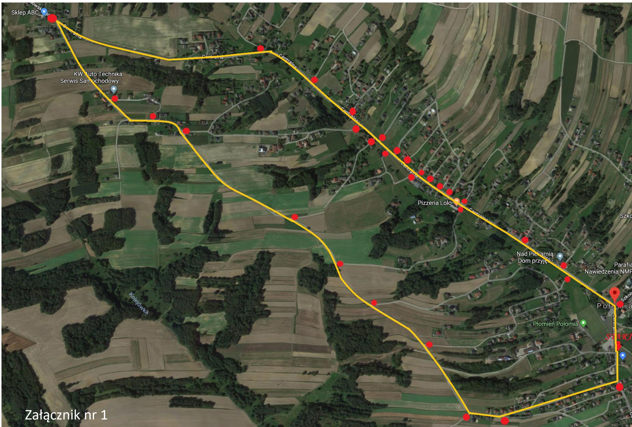
Załącznik nr 1